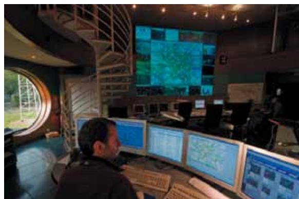
Salle opérationnelle du centre régional d'information et de coordination routières

De façon générale, les radios, les télévisions et la presse écrite sont le principal vecteur d'information pour les usagers, en particulier lorsqu'un phénomène météorologique de grande ampleur se produit.